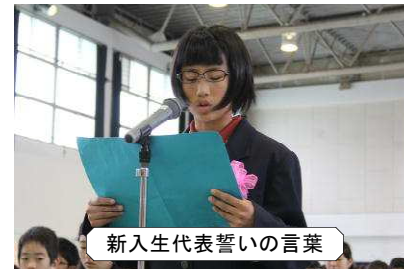
新入生代表誓いの言葉

「先輩方の後ろ姿を模範に、歴史と伝統ある春日西中学校の生徒として誇りを持ち、実りある学校生活を送ることを誓います。」